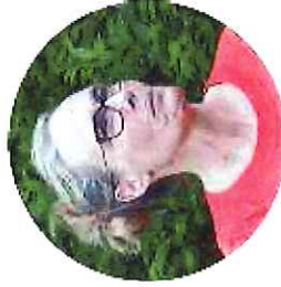
An Goossens Palliatief deskundige